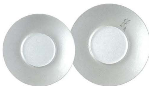
M45-03 ★RR24cmプレート(SV) 2,900円 240×30 JP M45-04 ★RR27cmプレート(SV) 4,500円 270×32 JP