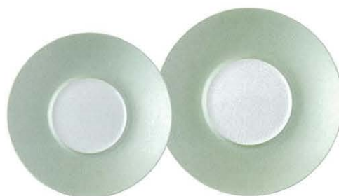
M45-07 ★RR24cmプレート(GR) 2,900円 240×30 JP M45-08 ★RR27cmプレート(GR) 4,500円 270×32 JP