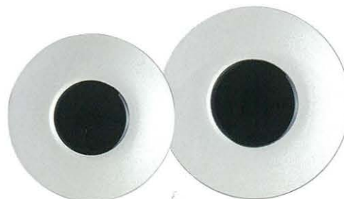
M45-11 ★RR24cmプレート(HP) 3,100円 240×30 JP M45-12 ★RR27cmプレート(HP) 4,800円 270×32 JP