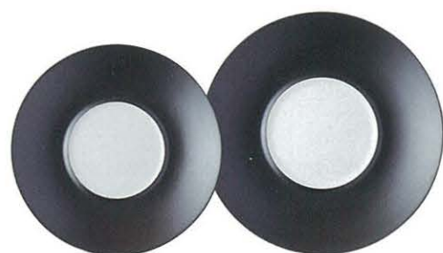
M45-09 ★RR24cmプレート(BR) 2,900円 240×30 JP M45-10 ★RR27cmプレート(BR) 4,500円 270×32 JP