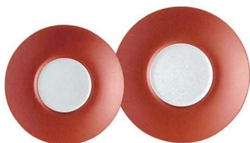
M45-05 ★RR24cmプレート(RD) 2,900円 240×30 JP M45-06 ★RR27cmプレート(RD) 4,500円 270×32 JP