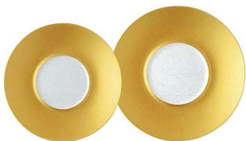
M45-01 ★RR24cmプレート(GL) 2,900円 240×30 JP M45-02 ★RR27cmプレート(GL) 4,500円 270×32 JP